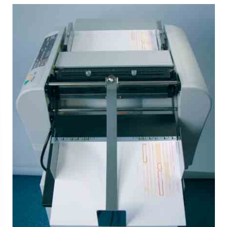
TF MASTER-A – Option Perforationseinheit z.B. für die Vorperforierung von Überweisungsträgern