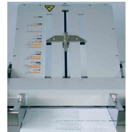
TF MASTER-M – Falztaschenschnelleinstellung mit selbsterklärender Skala und Feinjustage