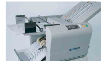
TF MASTER-M mit manueller Falzartenwahl

Überzeugen Sie sich selbst von den vielen Vorteilen. Wir stellen Ihnen die TF MASTER-Serie auch gerne persönlich vor.