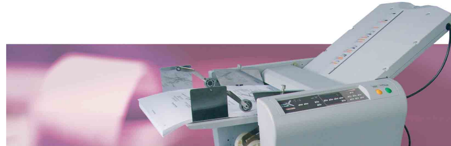
Die geniale Hilfe für Büro und Poststelle bei Formularen bis DIN A3