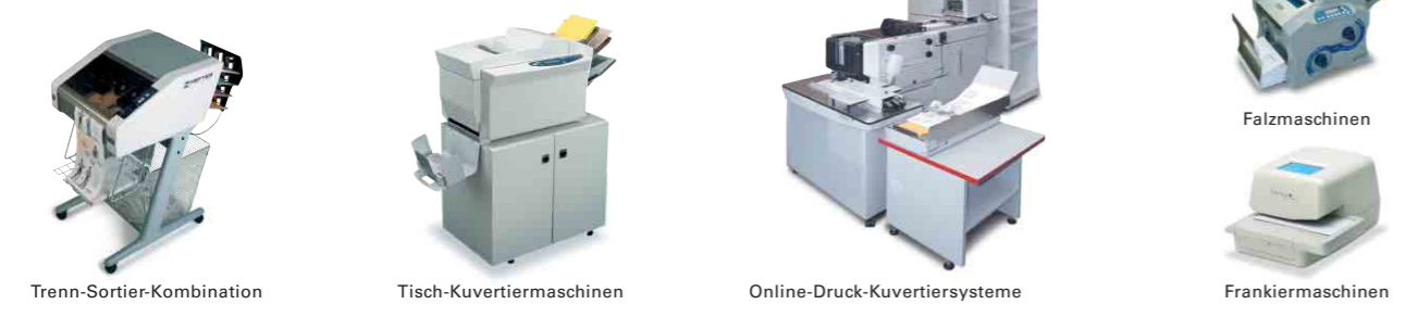
Trenn-Sortier-Kombination Tisch-Kuvertiermaschinen Online-Druck-Kuvertiersysteme Frankiermaschinen

Wir sind in Ihrer Nähe Weitere Informationen über Einsatzmöglichkeiten, Preise und Finanzierungsformen geben Ihnen jederzeit gerne unsere Werksvertretungen vor Ort.