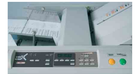
TF MASTER-A – zusätzliche Tasten für die automatische Falzartenauswahl und für die Abspeicherung von Sonderformaten