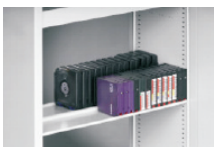
3590 / LTO / DLT